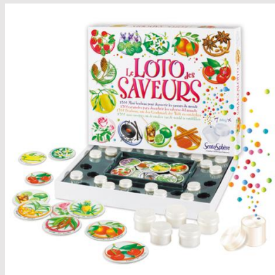
photo langage atelier senteur atelier saveur atelier son