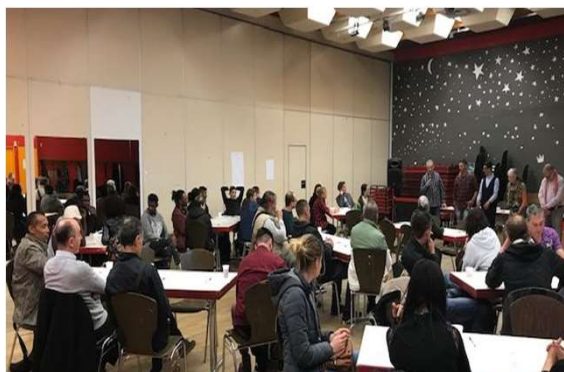
“Politique du Logement d’abord sur l’Eurométropole et la ville de Mulhouse : quelle(s) réponse(s) au sans-abrisme ?”, 3 avril, Strasbourg.

En 2019, la FAS a organisé deux plénières en Alsace et une plénière en Lorraine, A noter : la dernière plénière de l'année qui s'est tenue à Strasbourg le 26 novembre a été co-organisée par les représentants des territoires alsaciens et lorrains et a réuni des participants de ces deux territoires.