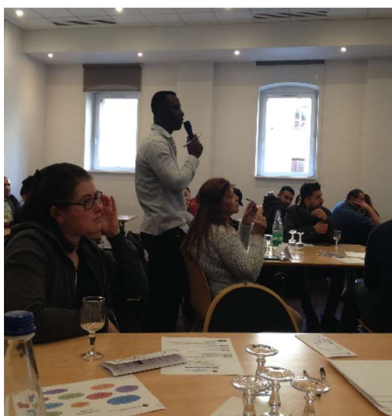
“18/25 ans, comment vivre ou survivre sans revenu ?”, 26 novembre, Strasbourg.