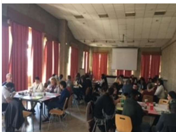
“La santé, venez en parler”, 12 avril, Maxéville.