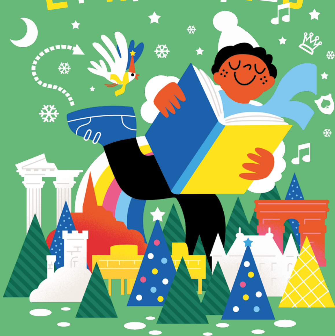
Illustration : Clod - Design graphique : Philzfer